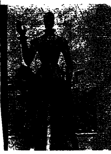
نثال لحد « الايطال » البرتغاليين في لواندا اصبح ملماً للانقسام بعد انسحاب القوات البرتغالية من انغولا

ضعف هيبة حكومة الوسط وكانت مصادر مطلعة في لشبونة قد تكررت ان قائد قوات الامن العسكرية رفض اقتحام الطوق البشري حول منزل رئيس الوزراء .